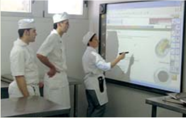
Las innovadoras pantallas tienen múltiples aplicaciones.

El pasado mes de enero se instalaron en los talleres de cocina del IES Escuela de Hostelería de Leioa unas modernas pantallas interactivas. Con estas nuevas instalacio-