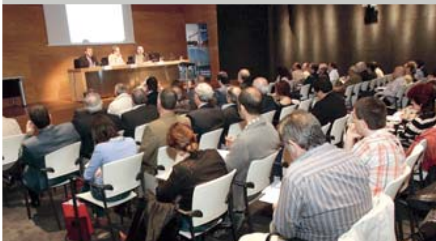
10. urteurreneko ospakizuna BEC!en izan zen. La jornada del 10º aniversario se desarrolló en el BEC!.

"Lanbide Heziketa: etorkizunera begiratzeko dugun, orainaldia ahaztu gabe" izenburupean, joan den maiatzaren 18an izan zen Ikaslan Bizkaiairen 10. urteurrena, BEC! Bilbao Exhibition Centren, eta 200 lagun inguru bertaratu ziren.